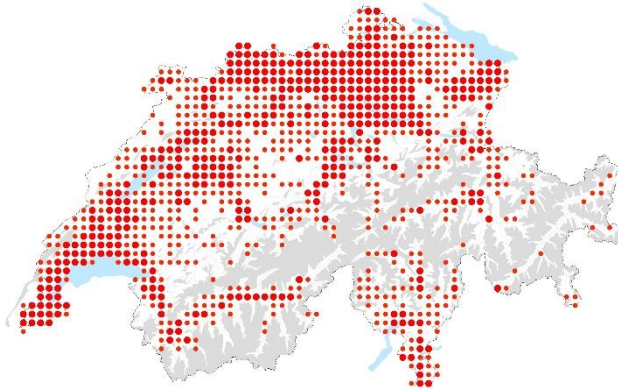
Verbreitungskarte Website Info Flora

Ursprünglich aus Nordamerika stammende, krautige Pflanze, die bereits im 17. Jahrhundert als Zierpflanze nach Europa eingeführt wurde. Obwohl das Einjährige Berufkraut heute nicht mehr vermarktet wird, ist es längst eingebürgert und hat dabei eine Vorliebe für gestörte Standorte. Ursprünglich eine Ruderalpflanze, breitet sich die Art rasant auf Magerwiesen aus und bedroht aktuell die dortige einheimische Flora.